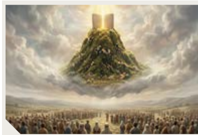
הרי ממש לפני כן אמרו כלל ישראל באיש אחד בלב אחד נעשה ונשמע! מדוע לכפות?

הגמרא מספרת לנו (שפת סח י"א) שבמעמד מתן תורה, הרים הקדוש ברוך את הר סיני מעל בני ישראל ואמר: "אם אתם מקבלים את התורה מוטב, ואם לאו שם תהא קבורתכם" קבלת התורה התקיימה בדרך של כפיה, ושואלים (תוספות על המקום): הרי ממש לפני כן אמרו כלל ישראל באיש אחד בלב אחד נעשה ונשמע! מדוע לכפות?